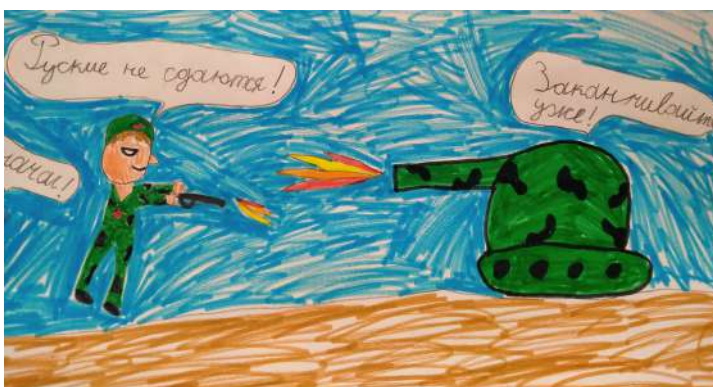
Ярослава Хххххххх 1Б