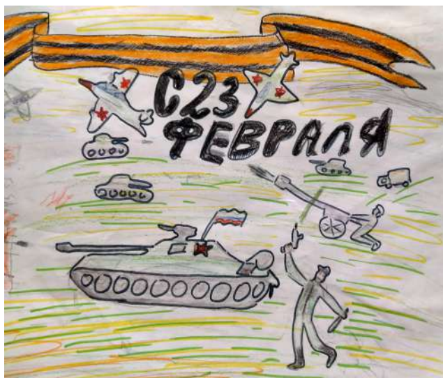
Архип Парамоненко 1Б