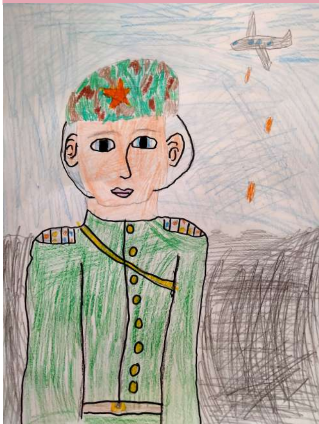
Вера Хххххххх 1А

Поздравляем педагогов, ребят, пап и дедушек!