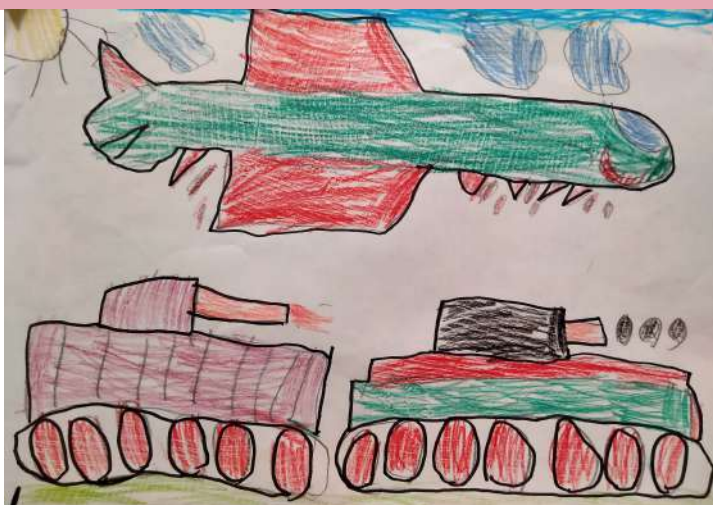
Ваня Романенко 1А